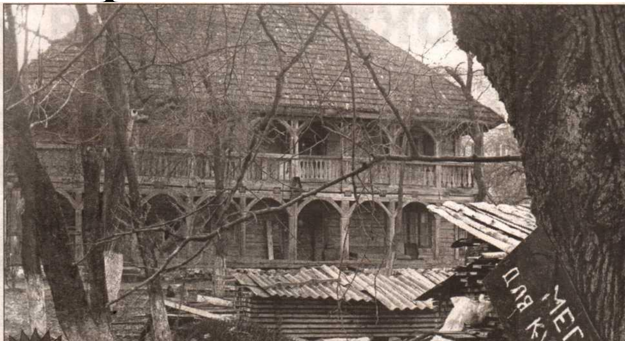
Здание ветшает, а денег на его реставрацию нет

«В большинстве источников», — читаем мы дальше, — в о времена постройки монастырского лямуса указан XII век — и это очень серьезно». «В России деревянные здания (не церкви) того возраста единицы», — заканчивается восторженно